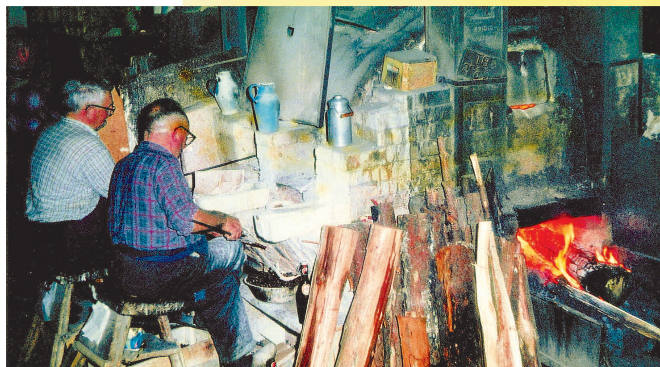
Glasperlenmacher am holzbefeuerten Ofen 1954.

Zur höchsten Blüte kam die Traßlhütte erst im 19. Jahrhundert, zur Zeit von Sigmund Lindners Betriebsgründung. Die heimische Glasperlenfabrikation mit ihren weltweiten Verbindungen war ein einträgliches Geschäft. Gearbeitet wurde im 2-Schichtsystem rund um die Uhr in einfachen, luftigen Holzhütten, ca. 12 Arbeiter pro Schmelzofen.